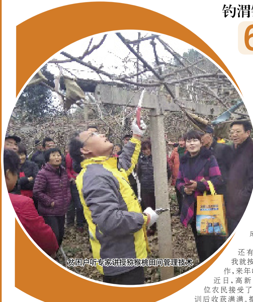
贫困户听专家讲授猕猴桃田间管理技术