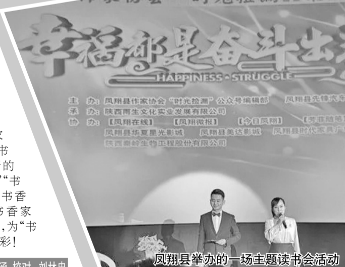
凤翔县举办的一场主题读书会活动