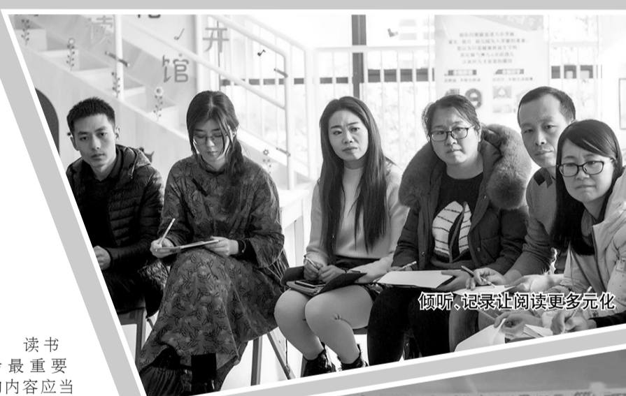
倾听·记录让阅读更多元化