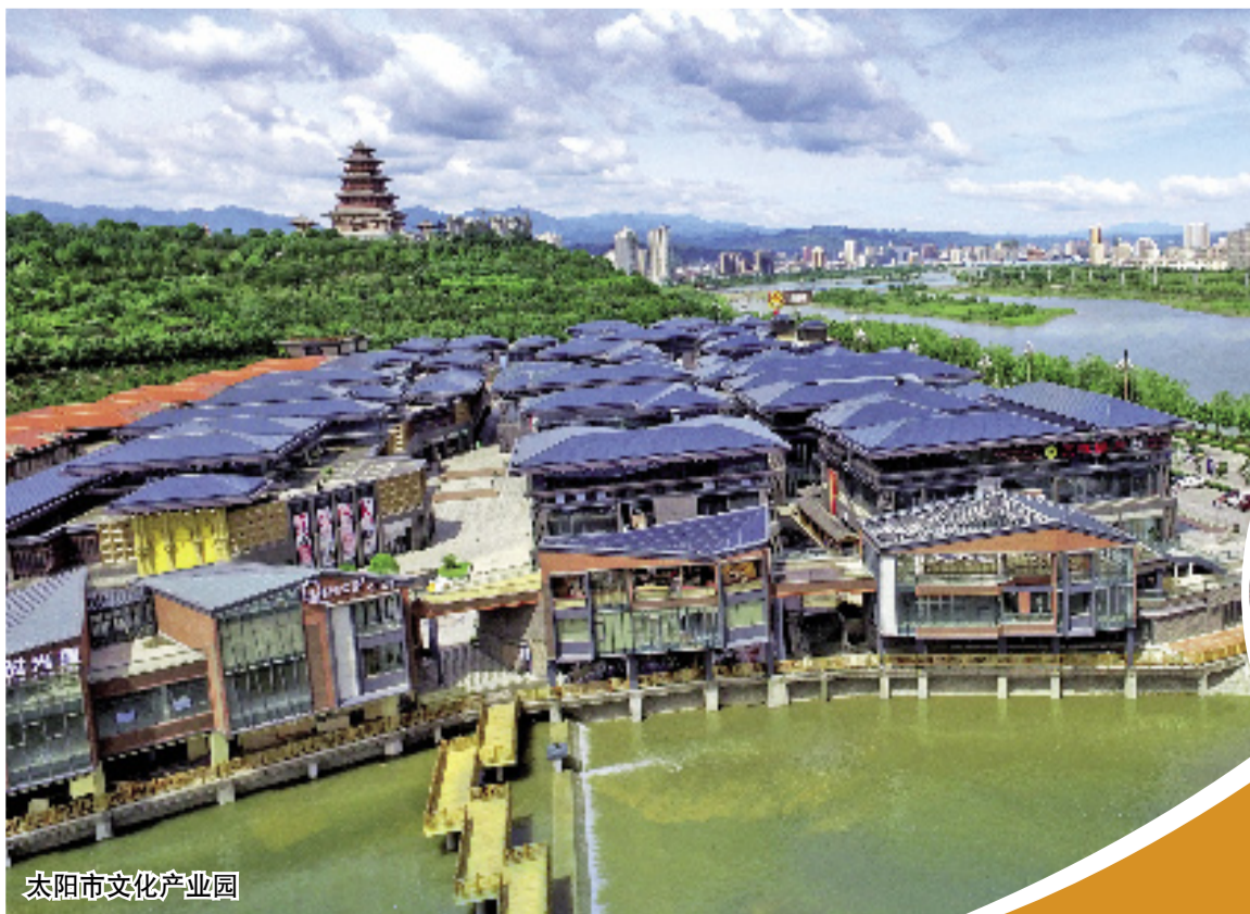
太阳光文化产业园