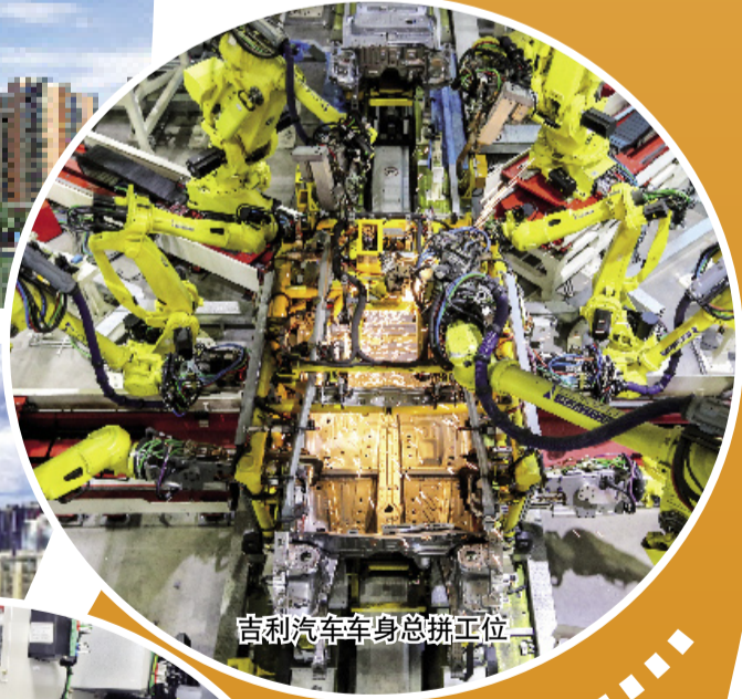
吉利汽车车身总拼工位