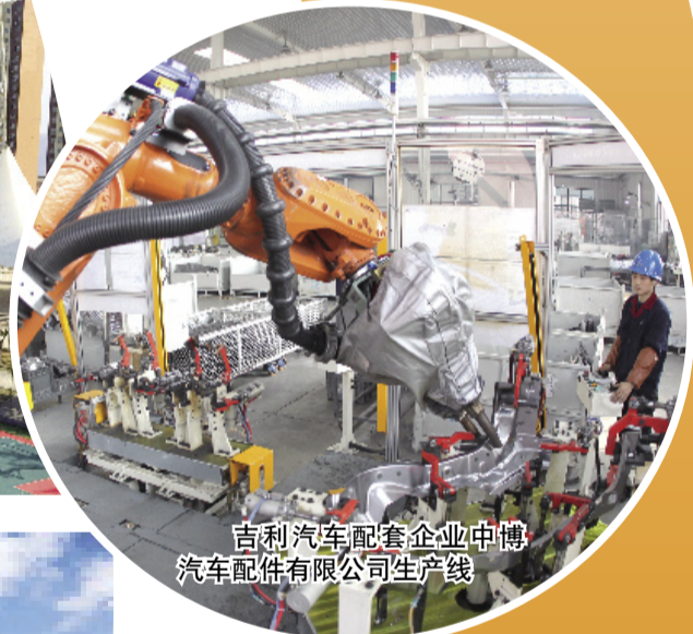
吉利汽车配套企业中博汽车配件有限公司生产线