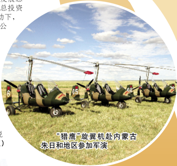
“猎鹰”旋翼机赴内蒙古朱日和地区参加军演

部件及石油装备产业园，持续做大做强汽车及零部件、钛及钛合金、高端装备制造“三个千亿级产业集群”。以发展枢纽经济、门户经济、流动经济为落脚点，强力推进53个项目和33个市级重点项目建设，提速高铁新城建设步伐，完成片区拆迁搬迁工作，打通站前大道、高新二路等主干道。谋划包装投资400亿元的商业、地产现代服务业项目，大力发展总部经济及生产性服务业。在总投资13.6亿元的宝鸡创新港带动下，高新区打造创新资源充沛的公园式、社区型创新基地，集创业、智造、研发、检测于一体的综合性孵化沃土。谋划占地5000亩水域的伐鱼河湿地公园，打造钓鱼台—伐鱼河文旅生态景观轴和文旅水街，推动完善湿地公园两翼工业布局，形成“一轴两翼两区”（钓鱼台—伐鱼河文旅生态景观轴、两翼工业布局、阳平物流园区、综合保税区）新的增长极。（徐小红）