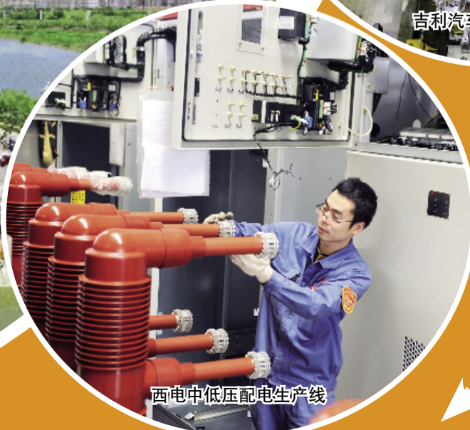
西电中低压配电生产线