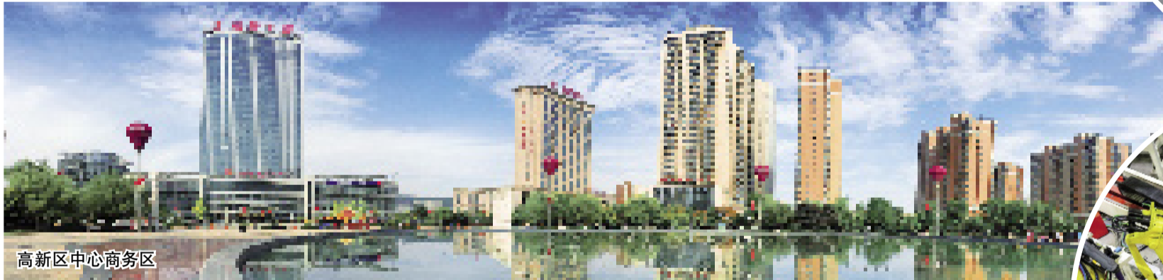
高新区中心商务区