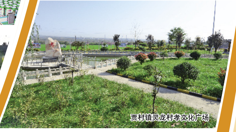
贾村镇灵龙村孝文化广场