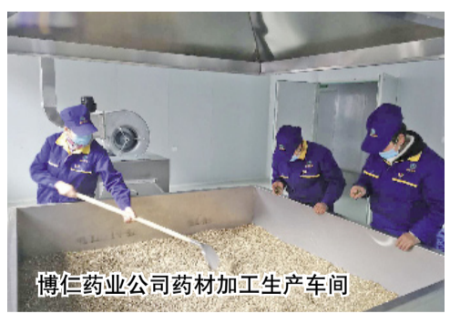
博仁药业公司药材加工生产车间