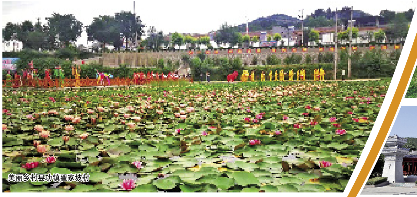
美丽乡村县功镇翟家坡村