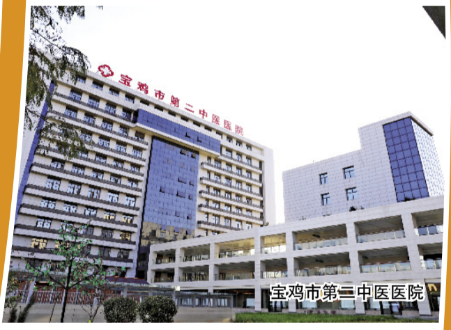
宝鸡市第三中医医院