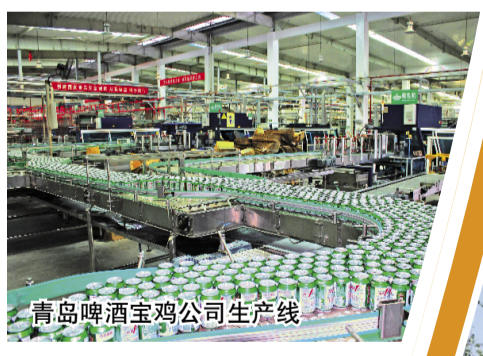
青岛啤酒宝鸡公司生产线