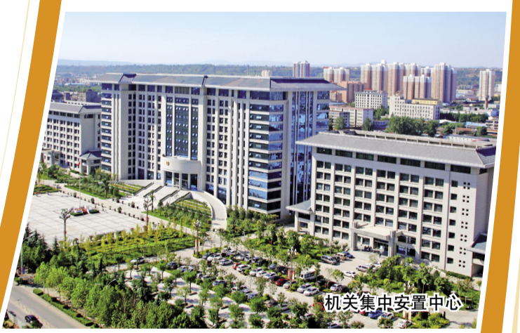
机关集中安置中心