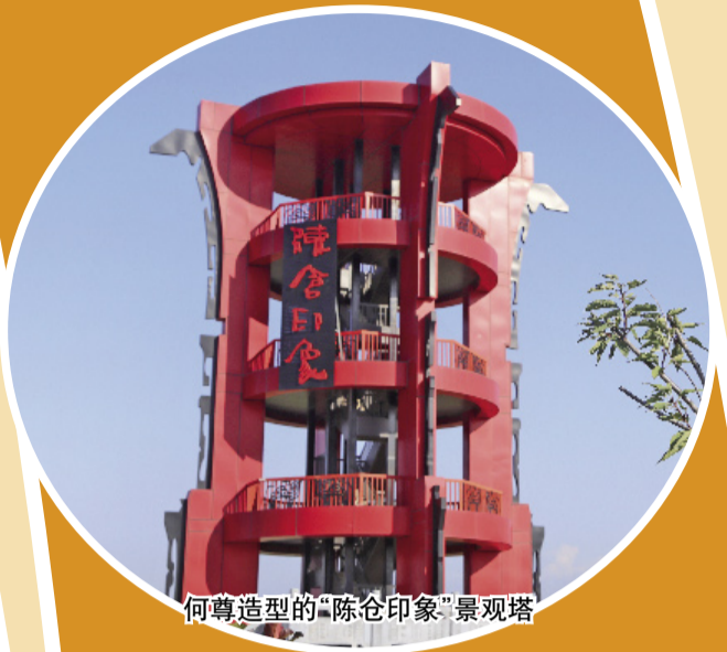
何尊造型的“陈仓印象”景观塔