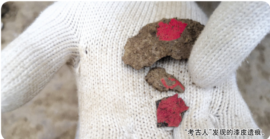
“考古人”发现的漆皮遗痕。

发现“黄肠题凑”的第一个实例,是已发掘出的时代最早、等级最高、形制最大的一套“黄肠题凑”。经检测,这些规整的椁木均由柏木芯做成,制作这套椁具,要用680多根百年以上树龄的柏木,据专家推测,至少需要300亩森林才能凑齐这些木料。