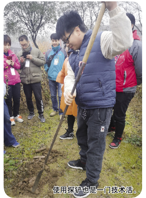
使用探铲也是一门技术活。

挖墓坑时,往往把各层颜色不同的熟土和生土挖出来,在下葬后,又把这些土混在一起回填到墓坑中,形成了“五花土”。一般来说,见到了“五花土”,就代表离找到墓葬不远了。