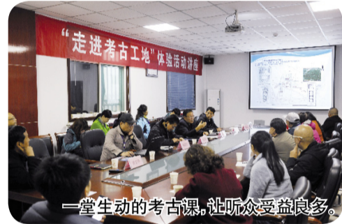
一堂生动的考古课,让听众受益良多。