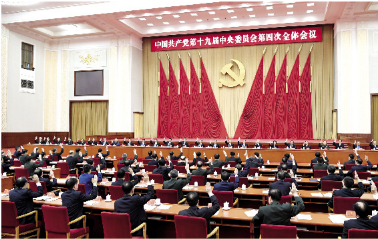
中国共产党第十九届中央委员会第四次全体会议,于2019年10月28日至31日在北京举行。中央政治局主持会议。