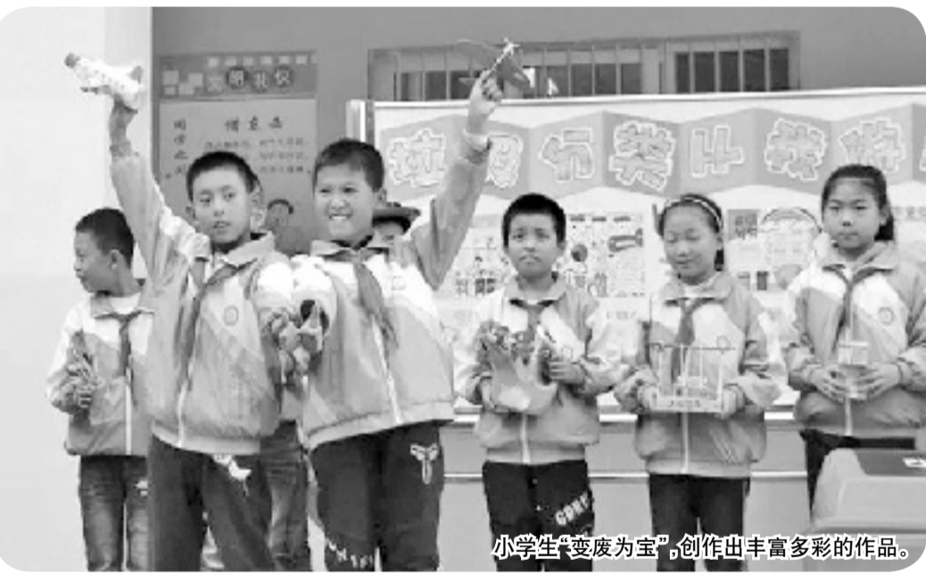
小学生“变废为宝”，创作出丰富多彩的作品。

本报讯 废弃塑料瓶制成“小飞机”，旧纸盒制成“篮球筐”……近日，在金台区代家湾小学举办的“变废为宝百变秀”活动中，代家湾小学师生用趣味活动，展示了垃圾分类知识进校园的学习成果。