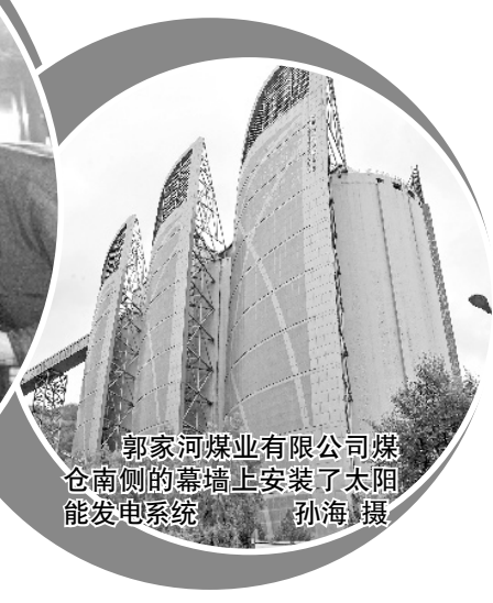
郭家河煤业有限公司煤仓南侧的墙壁上安装了太阳能发电系统