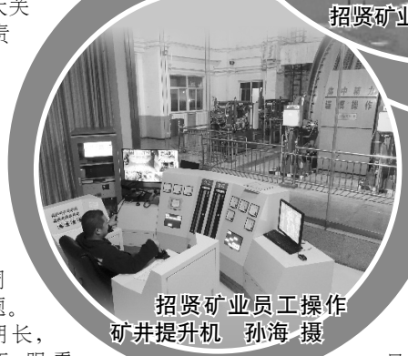
招贤矿业员工操作矿井提升机

业由国有企业皖北煤电集团控股,皖北煤电防治水、瓦斯治理技术和安全管理水平在全国处于领先地位,皖北煤电向招贤矿业派驻了一批优秀管理和技术骨干,在加大安全设施投入的同时不断提高员工的综合素质。同时,矿井一边建设一边布局“机械化、自动化、信息化和智能化”系统,让安全生产推动项目建设快进、稳进。