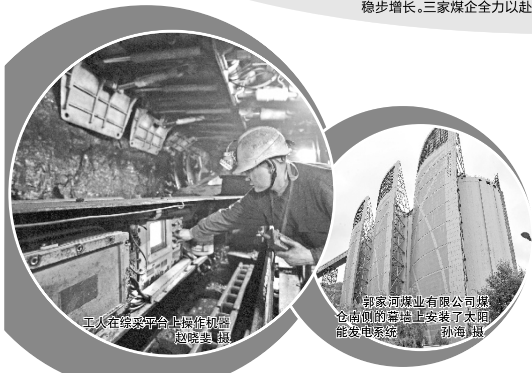
工人在综采平台上操作机器

此外,该矿在设计和建设中,以园林式和工业旅游矿井为目标,开辟井上井下旅游线路,让人们既可领略到现代化采煤的先进技术,又能体验到工业生产与自然环境的有机融合,企业因此获得“全国生态文明矿井”称号,全国仅有7家煤矿获此殊荣。