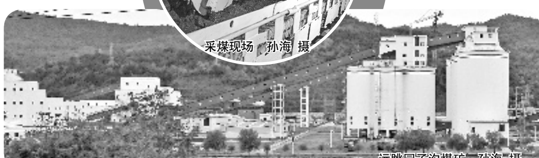
远眺园子沟煤矿

煤矿通过采矿技术、信息技术、通信技术、自动控制技术、物联网技术集成,使得智慧矿区建设实现了从规划设计到实际生产的转变,实现了矿区生产管理的精细化、自动化、智能化和无人化。