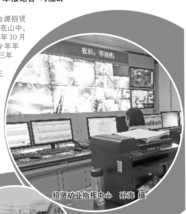
招贤矿业指挥中心