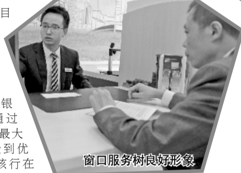
窗口服务树良好形象