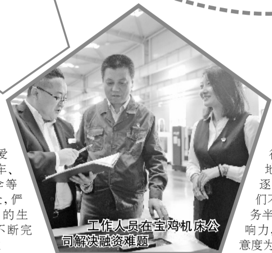
工作人员在宝鸡机床公司解决融资难题

移动发卡机、金融自助通、VTM等智能化设备的大量应用,让兴业银行办理业务的每一位客户都感受到了手续的简化和流程的快捷。如今,无论您走进兴业银行宝鸡分行的哪一处营