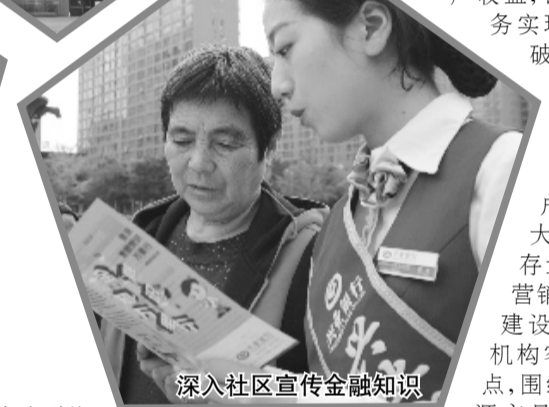
深入社区宣传金融知识