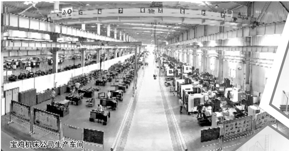
宝鸡机床公司生产车间

等领域持续发力,实现重点突破。芳华而立,凤凰正举再扬帆。站在新起点,兴业银行宝鸡分行将直面机遇与挑战,在新一轮竞争中行稳致远,坚守“一流银行、百年兴业”的远大理想,脚踏实地、砥砺前行,搭乘宝鸡经济社会发展的高速列车,不遗余力地为地方经济发展贡献力量。