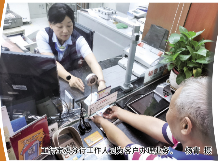
工行宝鸡分行工作人员为客户办理业务。