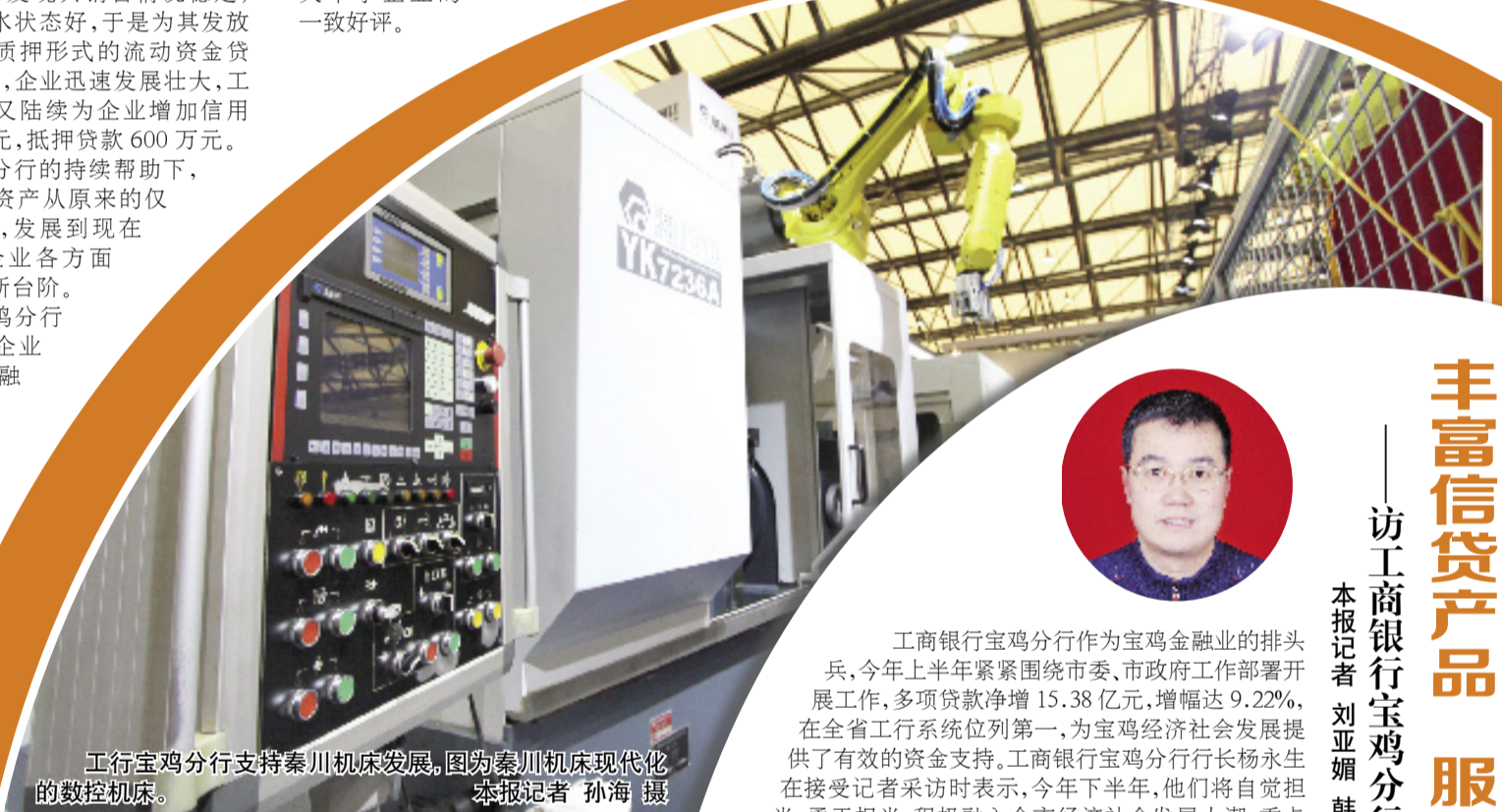
工行宝鸡分行支持秦川机床发展,图为秦川机床现代化的数控机床。

此外,“网上小额信用贷款”“经营快贷”“E抵快贷”等新产品不断问世,形成网上小额贷款方便、快捷、智能化等诸多新优势。今年以来,共向101户小微企业及个体工商户发放“经营快贷”9316万元。为破解“融资难、融资贵”问题,