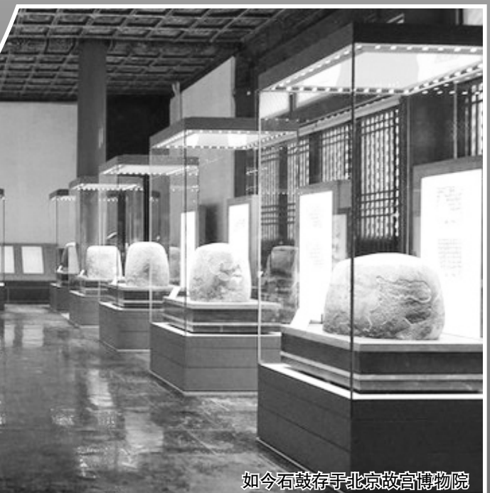
如今石鼓存于北京故宫博物院