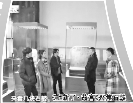
来看几块石鼓，《上新了·故宫》聚焦石鼓