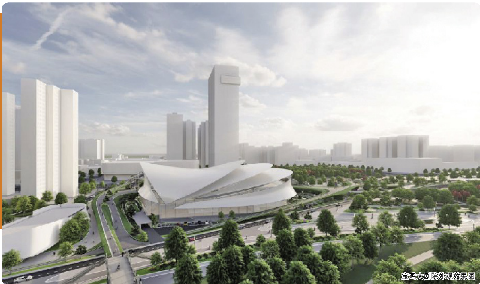
宝鸡大剧院外观效果图

今年的市政府工作报告提到,积极做好第九届陕西省艺术节筹备工作,建成市文化艺术中心,启动宝鸡大剧院的建设。随着市文化艺术中心渐露芳容,宝鸡大剧院建设便成为群众关心的话题。宝鸡大剧院将选址何处,怎样建设,未来会是什么样?带着这些问题,记者前往宝鸡大剧院项目领导小组采访。