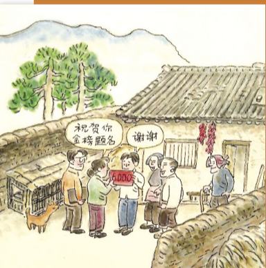
教育扶贫是关键,让娃赢在起跑线。