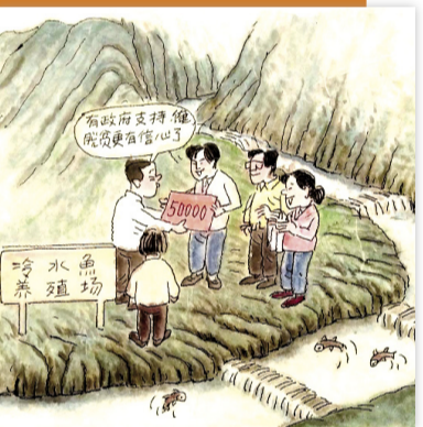
金融扶贫有力度,精准贷款到农户。