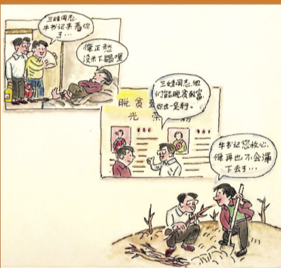
浪子立志摘穷帽,再不躺着等靠要。