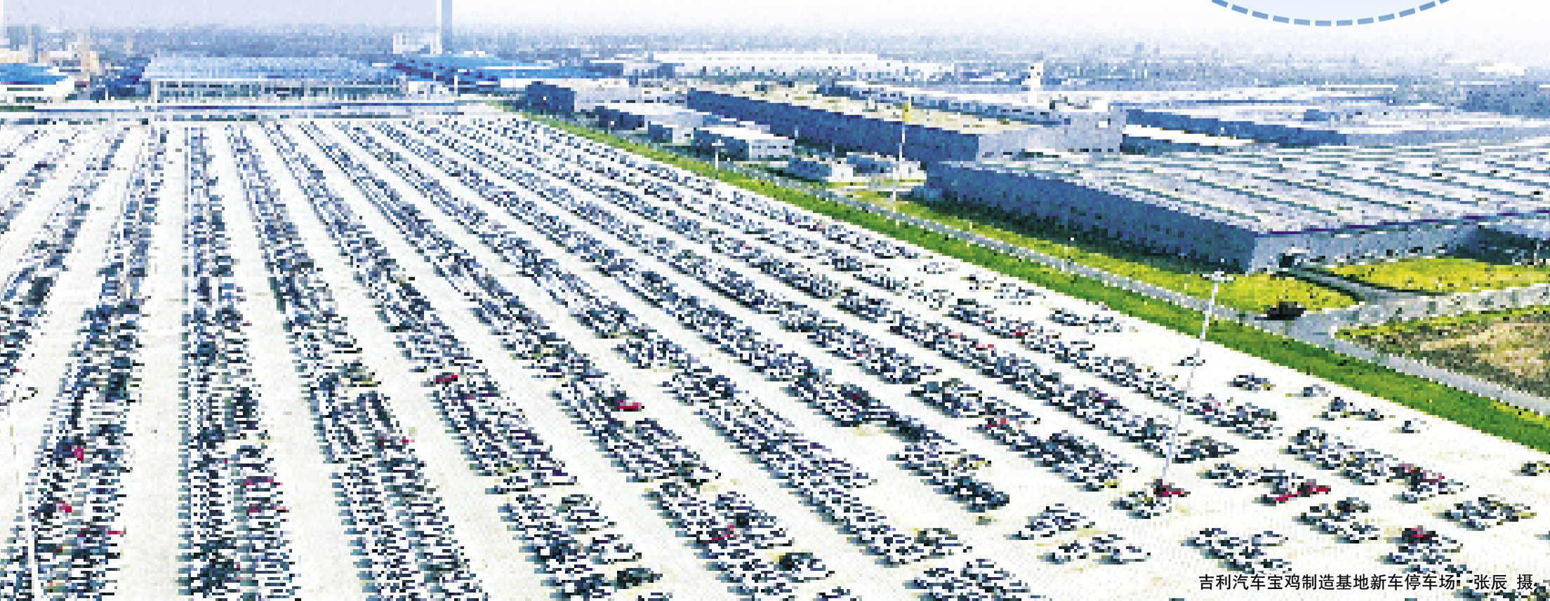
吉利汽车宝鸡制造基地新车停车场