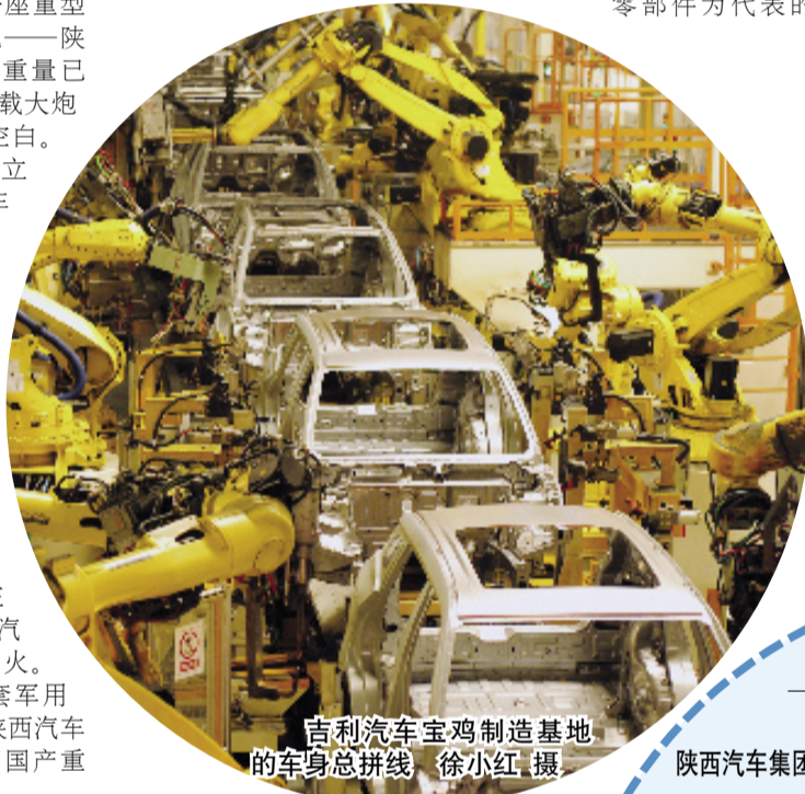
吉利汽车宝鸡制造基地的车身总拼线

随后的10年间，北方动力、汉德车桥、华山路等国企纷纷由工厂制变为公司制，步入发展的快车道。