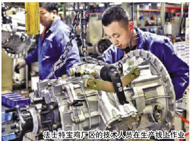
法士特宝鸡厂区的技术人员在生产线上作业