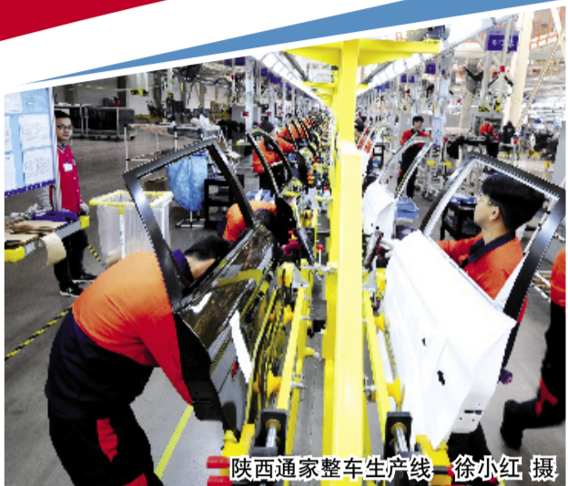
陕西通家整车生产线