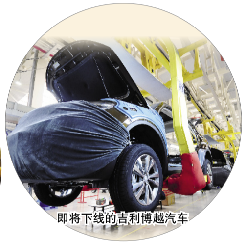
即将下线的吉利博越汽车

市汽车及零部件产业跨越发展按下了快进键；2017年，吉利汽车发动机项目的引进，填补了陕西省汽车产业链上的空白。当时，吉利博越汽车在国内市场可谓“一车难求”，装着吉利“芯”的出租车在伦敦随处可见。这是宝鸡汽车产业实力大增的最好诠释。