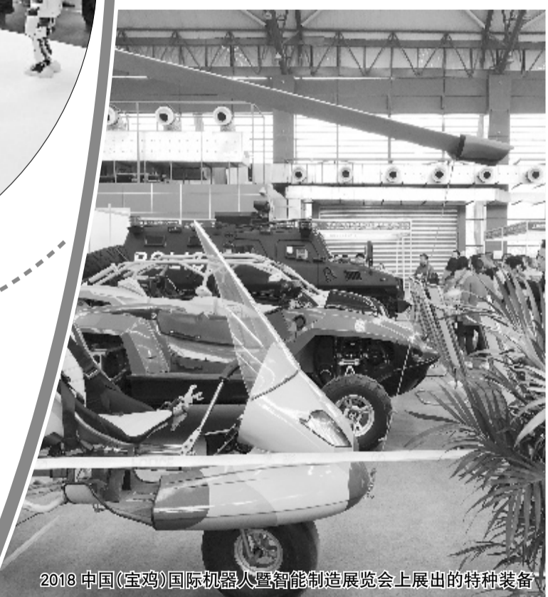
2018中国(宝鸡)国际机器人暨智能制造展览会上展出的特种装备

体展位面积达540平方米,是目前宝鸡办展单体面积最大的展位。而且展商的满意度在95%以上,有70%以上的展商咨询明年展会的情况。