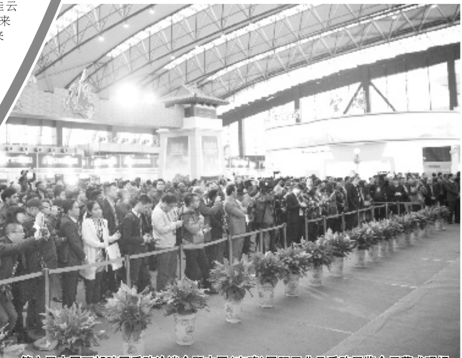
第六届中国西部跨国采购洽谈会暨中国(宝鸡)国际工业品采购展览会开幕式现场

长风破浪会有时,直挂云帆济沧海。对宝鸡市贸促会来说,一个全新的时代已经来临,在全球化的大融合中,期待他们为宝鸡经济腾飞注入超级动能!