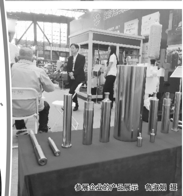
参展企业的产品展示