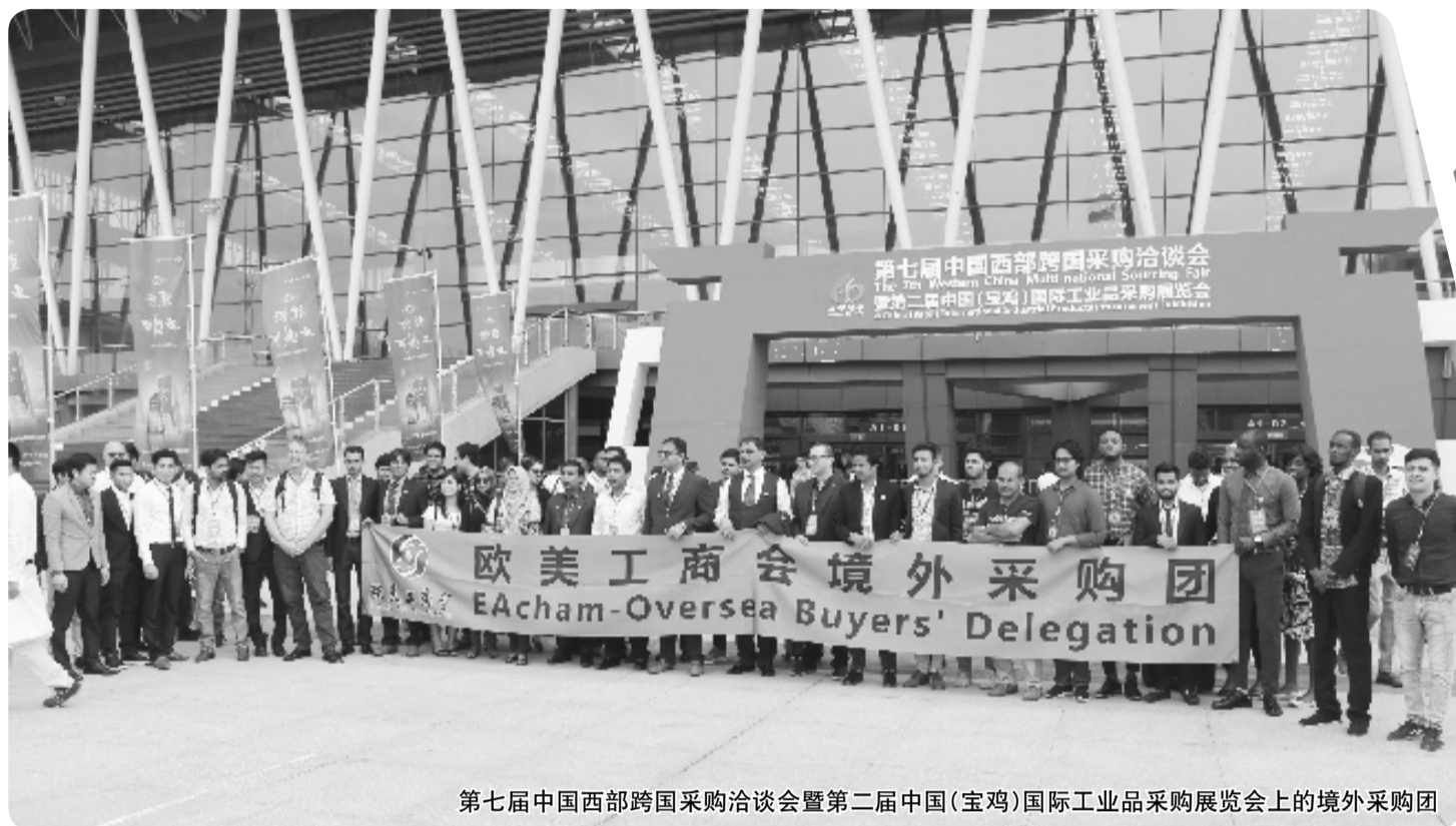
第七届中国西部跨国采购洽谈会暨第二届中国(宝鸡)国际工业品采购展览会上的境外采购团

5月31日,第三届中国(宝鸡)国际工业品采购展览会(石油装备跨国采购会)在我市落下帷幕。三天时间,220家行业龙头企业、2.4亿元的意向成交量,让采购商满意而归;国际化、品牌化、专业化的办展思路,全方位展示了宝鸡石油装备业、智能制造业以及历史文化和特色美食,给各国客人留下了美好的回忆。