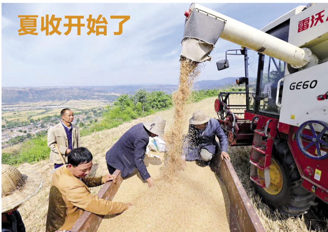
这两天,凤翔县长青镇石头坡村麦田里一派火热的夏收场面,联合收割机在地里穿梭,不断“吐出”金黄的麦粒,村民们忙着装麦子,脸上露出丰收的喜悦。凤翔县夏粮种植面积约55.56万亩,其中小麦54.45万亩,截至6月3日下午,全县已收小麦1.23万亩、油菜1万亩。

来,提高准入门槛,抓好园区专业化建设,增强园区吸引力,形成上下游专业配套产业集群。要加大宣传力度,引导特色产业做大做强,打造一批品牌产品,为县域经济高质量发展作出积极贡献。市领导王都让,市扶贫办、工信局、农业农村局等部门负责同志参加调研。 本报记者 胡红玲