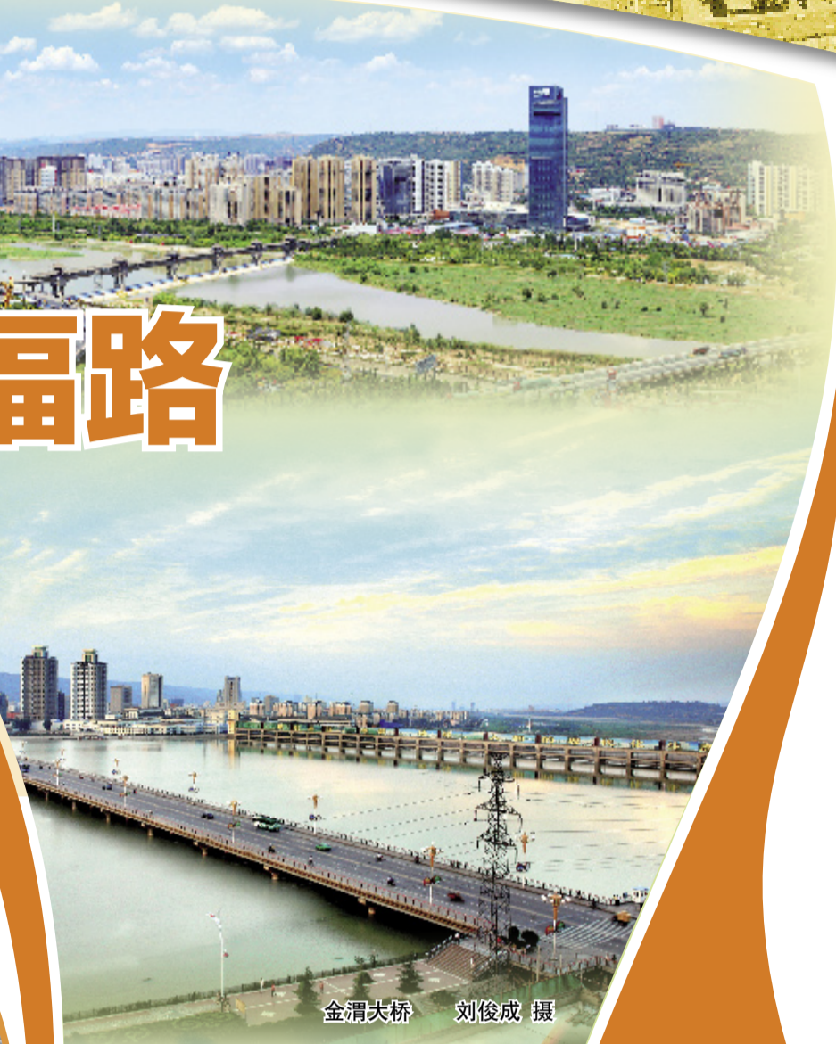
金渭大桥