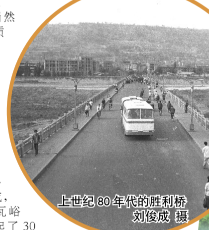
上世纪80年代的胜利桥