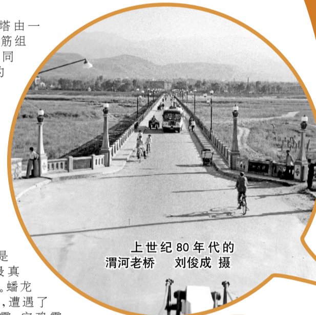
上世纪80年代的渭河老桥

每座桥的建设都带着城市“成长”的印记。从木桥到石桥,从跨河桥到立交桥,城市的骨架不断拉大,一座座桥梁为宝鸡经济社会发展插上了腾飞的“翅膀”,市民的幸福感越来越强!