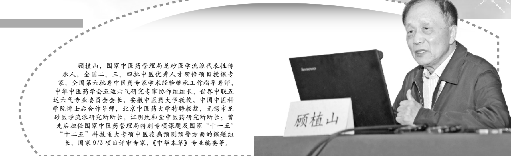
顾植山,国家中医药管理局龙砂医学流派代表性传承人,全国二、三、四批中医优秀人才研修项目授课专家,全国第六批老中医药专家学术经验继承工作指导老师,中华中医药学会五运六气研究专家协作组组长,世界中医药五运六气专业委员会会长,安徽中医药大学教授,中国中医科学院博士后合作导师,北京中医药大学特聘教授,无锡市龙砂医学流派研究所所长,江阴致和堂中医药研究所所长;曾先后担任国家中医药管理局特别专项课题及国家“十一五”“十二五”科技重大专项中医药病预测预警方面的课题组长,国家973项目评审专家,《中华本草》专业编委等。