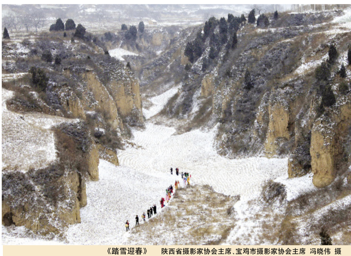
《踏雪迎春》

人民中间蕴藉着丰富的艺术宝藏。民间指人民中间,是广大人民群众生活的文化空间。它是沃土,散发着地域文化的芳香;它是草根,最具大众文化特质;它是宝藏,富含人生体验的酸甜苦辣。当然民间文化优劣杂糅,需要文艺家遵循当代价值理想分辩辨识提炼熔铸。鲁迅笔下的华老栓、祥林嫂、阿Q等就是作家基于对中国社会启蒙重建的认识,从浙东民俗生活中提炼创造出来的。刘心武之所以被选为改革开放四十年的优秀作家,也是他敏锐地发现和塑造了团支书谢惠敏、宋宝琦一类人的“文盲”形象。在这些形