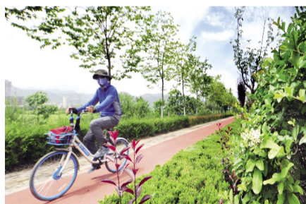
渭河岸边的骑行者