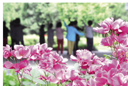
市民在渭河公园跳舞