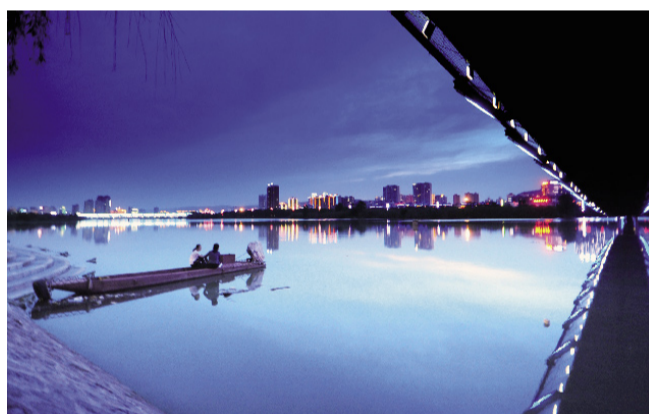
傍晚的渭河恬静安逸

这项民心工程进展飞速,因为渭河滩里廊桥的烟雨、长堤的柳浪、湖水的波光,以及数不清的大小景观,如同美妙的音符跳跃,谁不想早日把它们谱成宝鸡生态文明的乐章呢?