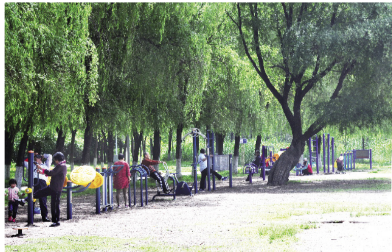
市民在渭河公园健身