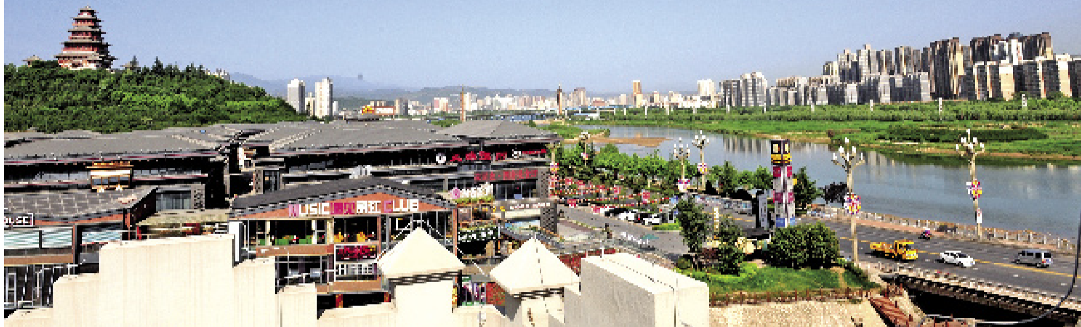
渭河美景与两岸建筑风格融为一体