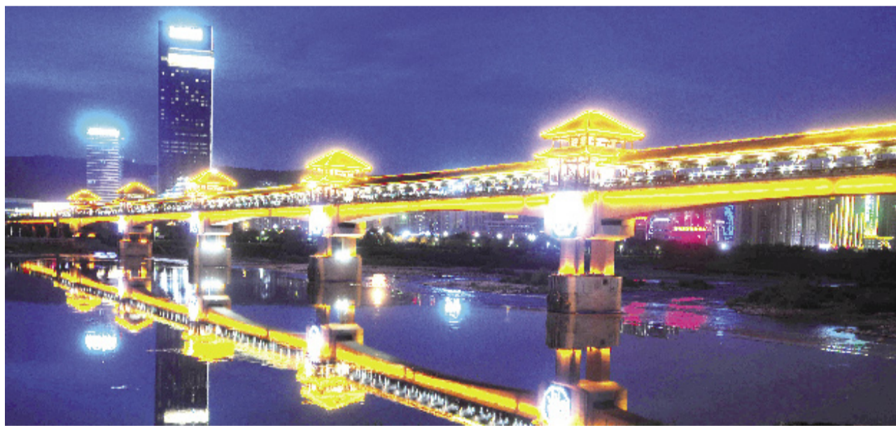
横跨渭河两岸的廊桥流光溢彩