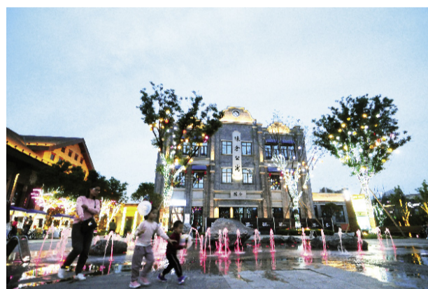
岸边繁华的商业街