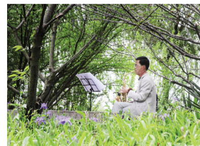
音乐爱好者在渭河公园练习萨克斯