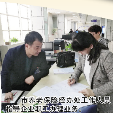
市养老保险经办处工作人员指导企业职工办理业务。

民生是最深的牵挂,幸福是永恒的追求。作为“新农保”制度的发源地,我市将不断打造“宝鸡模式”升级版,建设最具幸福感城市,让群众生活更安逸,让社会更和谐。