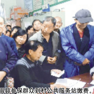
眉县参保群众到村公共服务中心缴费。