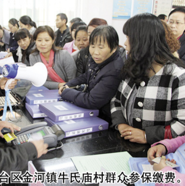
金台区金河镇牛氏庙村群众参保缴费。