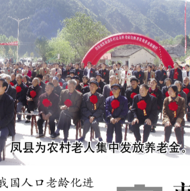
凤县为农村老人集中发放养老金。