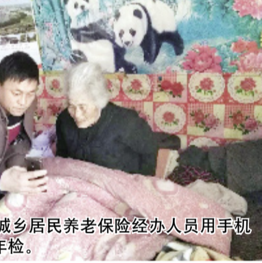
平阳县城乡居民养老保险经办人员用手机APP帮老人年检。