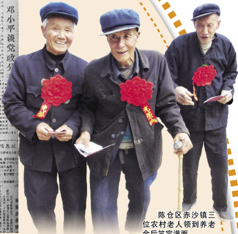
陈仓区赤沙镇三位农村老人领到养老金后笑容满面。