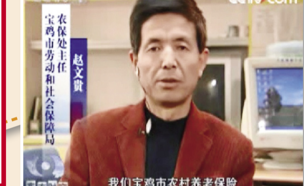
我们宝鸡市农村养老保险

干,退休后的生活就不犯愁了。”这个区工交系统共有集体企业二十二个,职工二千六百多人,区上在给他们下达今年的经济指标时,把养老金和利润捆在一起进行考