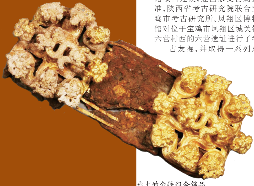
出土的金铁组合饰品