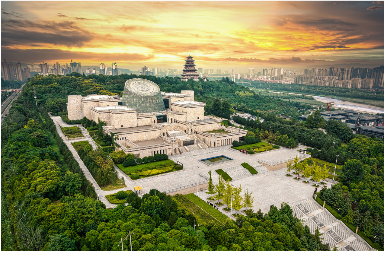
宝鸡青铜器博物院（无人机照片）

仲冬时节，三秦大地寒风凛冽，陕西宝鸡青铜器博物院内却游人如织。在博物院第二展厅中