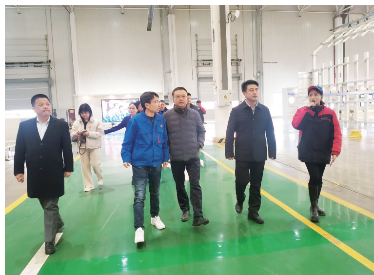
银行工作人员前往企业调研

这是中国银行宝鸡分行深耕普惠金融领域的一个缩影。近年来，中国银行宝鸡分行坚持金融服务实体经济的根本宗旨，不断提升金融服务的便利性和可得性、扩大覆盖面。近几年，该行依托“线上+线下”双轮发展路径，综合运用大数据等金融科技手段，有效拓宽融资服务场景，陆续推出了猕猴桃果商贷、岐山“一碗面”贷、粮商贷、白酒产业贷等特色产业定制场景授信产品，优化融资模式，打造特色品牌，持续完善综合金融服务体