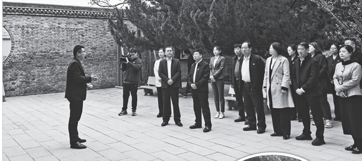
市总工会党员干部在眉县张载祠开展党风廉政专题“主题党日”活动

为不断强化作风建设，锻造一支廉洁自律的先锋队伍，市总工会今年积极组织党员干部阅看各类典型案例通报，参加各类廉政文化活动及党规党纪知识测试，并深入开展