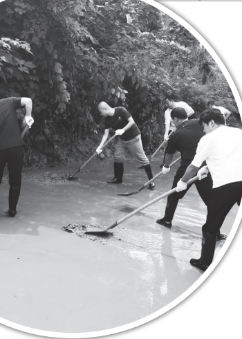
市总工会党员干部在任家湾车站棚户区清淤