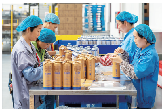
宝鸡无时闲青年酒业啤酒灌装车间