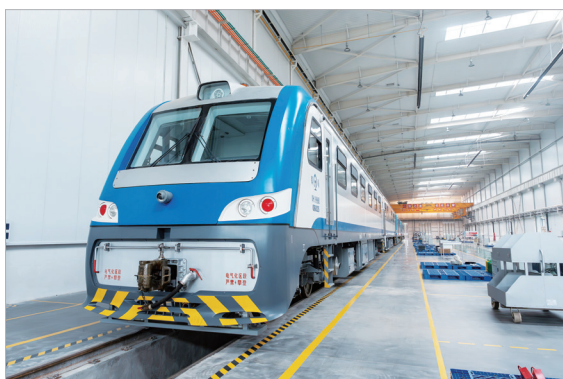
宝鸡中车时代专业化轨道交通工程机械整机制造基地