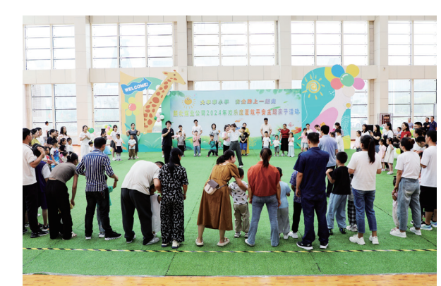
欢乐度夏筑平安主题亲子活动（资料图）

文化是企业的根和魂，有灯塔般的指引作用。近年来，麟北煤业以“福”文化为引领，秉承安全、高效、节能、环保、和谐、现代化的管理理念，向着建设国内一流绿色能源企业不断奋进。近日，记者来到麟北煤业进行采访，了解其“福”文化背后的深刻内涵，探寻企业高质量发展的奥秘。