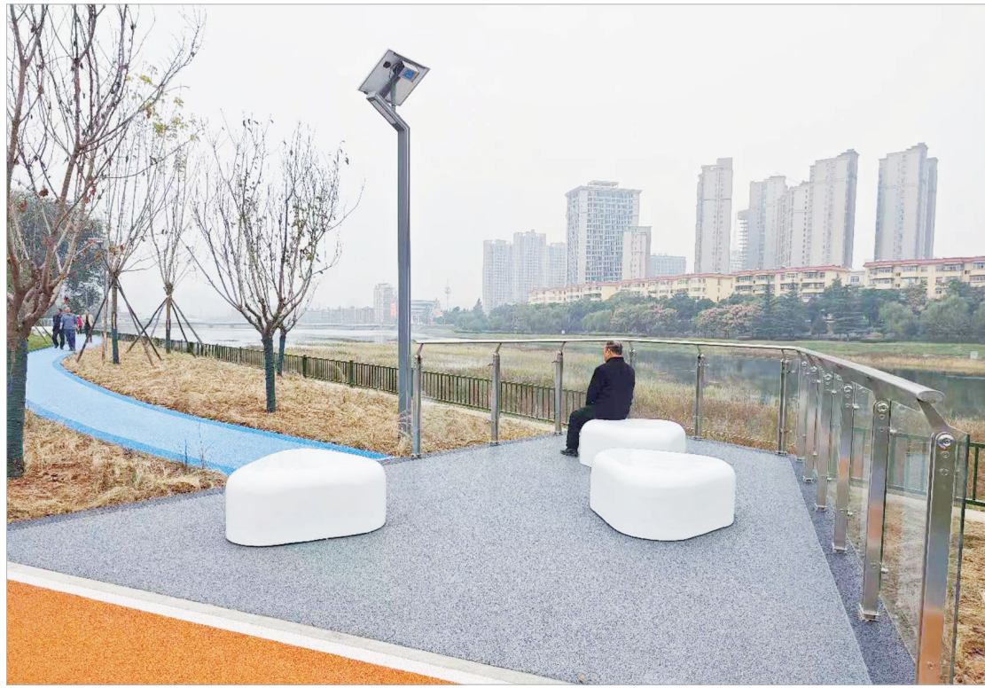
新修建的宝石文化广场

在金台区，像这样变“废地”为“宝地”的事不在少数。该区结合城市更新，充分利用拆迁腾退空地、荒弃闲地、零碎边角地等，进行定制化设计、小切口改造，实现了喜人