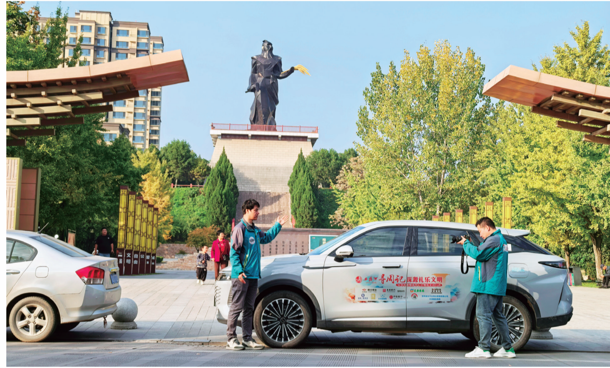
追寻周人的足迹, 记者来到杨凌教稼园采访。

此次采访行动, 采访团队将通过实地探访、专家对话等方式, 系统梳理周文化的发展脉络, 挖掘其历史价值和时代意义, 通过全媒体平台, 以图文、视频、音频等多种形式, 生动展现周文化的魅力和内涵, 让更多的人了解周文化、认同周文化、传承周文化。