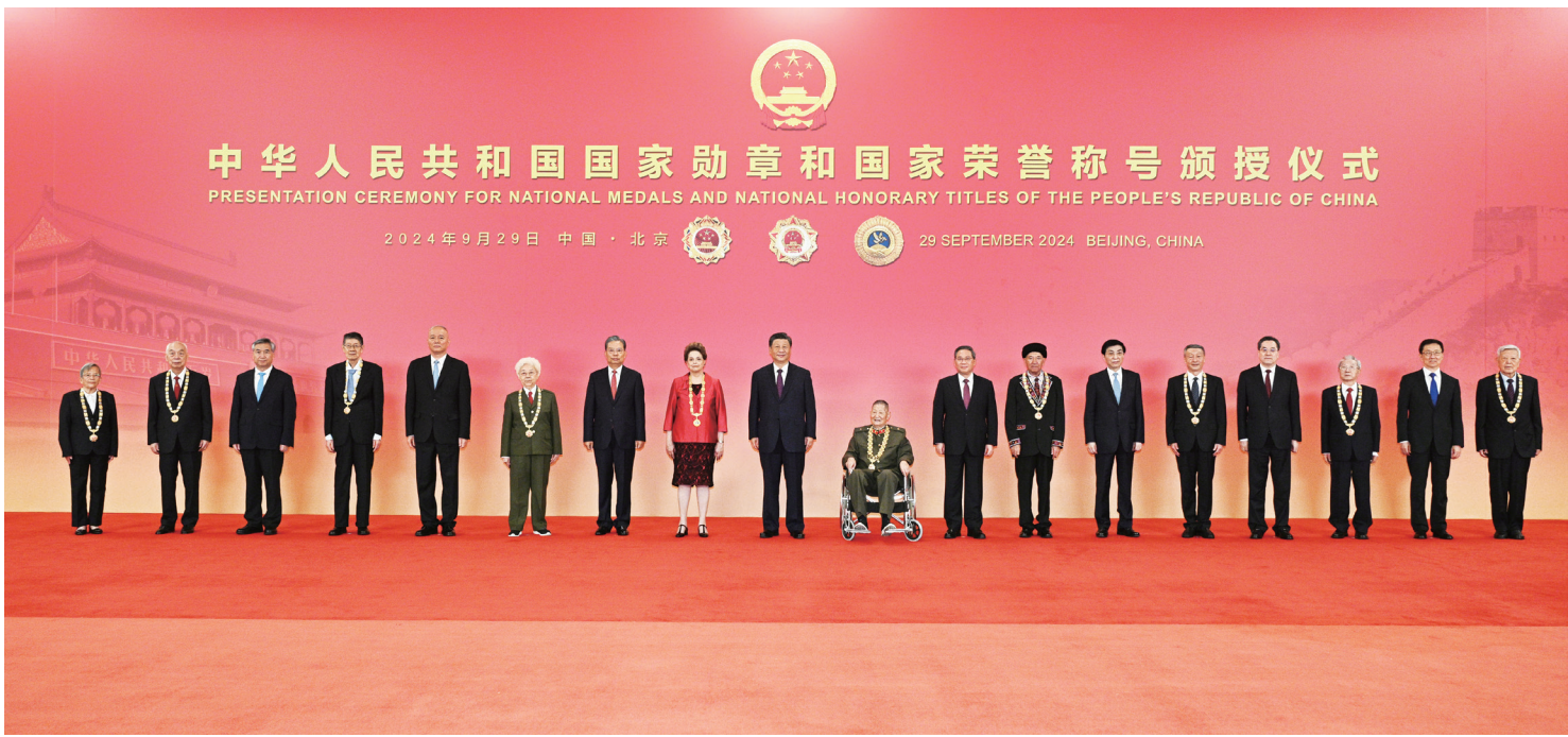
9月29日，中华人民共和国国家勋章和国家荣誉称号颁授仪式在北京人民大会堂金色大厅隆重举行。中共中央总书记、国家主席、中央军委主席习近平向国家勋章和国家荣誉称号获得者颁授勋章奖章并发表重要讲话。