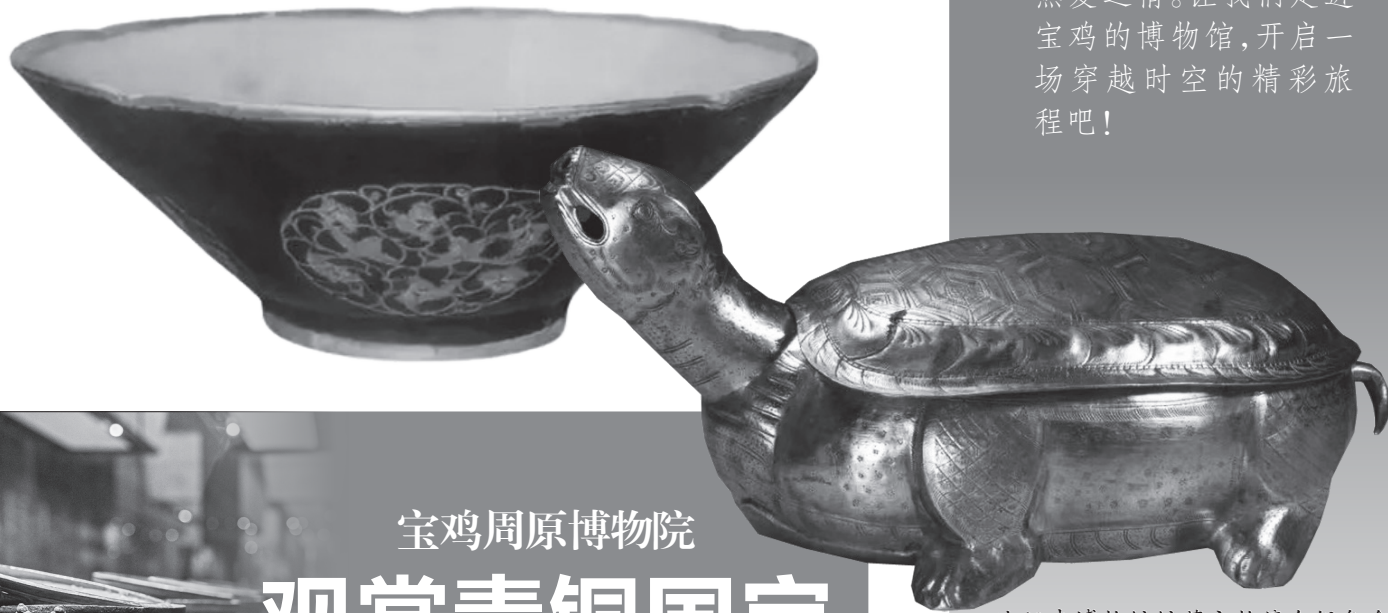
法门寺博物馆馆藏文物鎏金银龟盒

据了解,在全国“博物馆热”的形势下,法门寺博物馆的参观人数也在不断增长。为了吸引更多游客走进博物馆,提高博物馆的知名度和影响力,今年以来,法门寺博物馆开展了丰富多彩的社教活动,如在“博物馆日”举行了唐代宫廷茶艺表演和唐茶现场品饮活动,在暑假期间举行了香文化研学游等。今年8月,“地宫探秘”数字馆开启,以1:1复原的法门寺唐代地宫,以侧剖的形式还原展示地宫场景,有地宫面世时的珍贵照片、有秒入大唐的影片、有互动版的“电子乐高”、有可以触摸的文物复制品、有展示文物纹饰细节的数字动画等,受到青少年参观者的喜爱。国庆期间,“地宫探秘”数字馆将持续开放,期待游客们前来探秘。