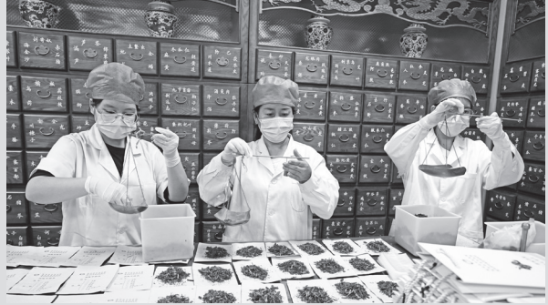
药房工作人员在调配中药

奥区，也写作隗(wei)奥区，他是中医五运六气学的祖师，据记载，隗奥区死后葬在凤翔梁山附近。可以说，为后世中医学奠基的《黄帝内经》与宝鸡渊源很深。”