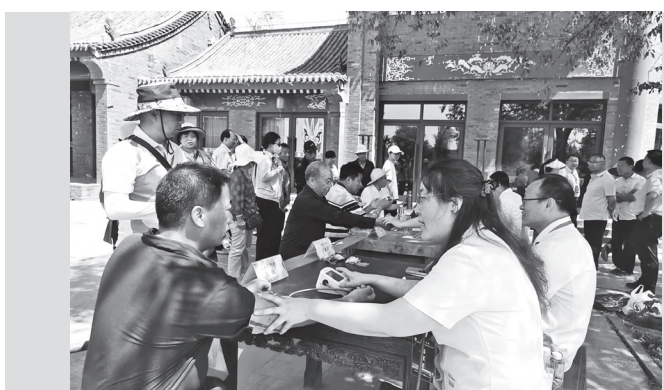
医生们在岐伯和园进行义诊

陕西省中医药文化科普巡讲专家团成员、宝鸡市中医医院治未病科主任、出身于中医世家的王凯军说：“在《黄帝内经》中提到的重要人物，除了与宝鸡岐山息息相关的岐伯之外，还有一位鬼