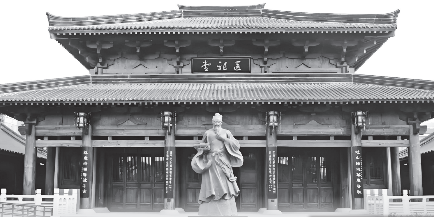
位于太平塔文化旅游街区的岐伯纪念馆