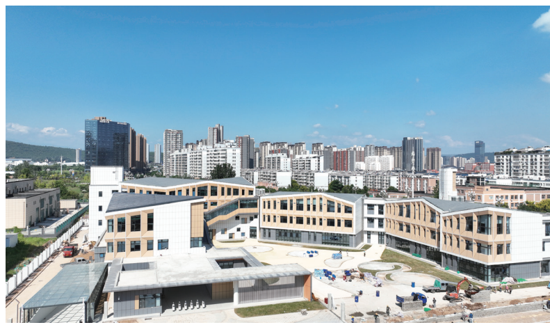
今年九月建成投用的宝鸡高新第三幼儿园