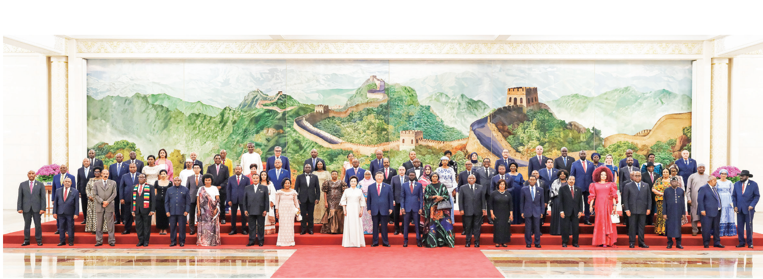
9月4日晚，国家主席习近平和夫人彭丽媛在北京人民大会堂举行宴会，欢迎来华出席中非合作论坛北京峰会的非方及国际贵宾。这是宴会前，习近平和彭丽媛同贵宾们集体合影留念。