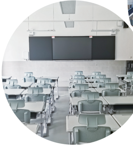
宝鸡高新第三小学北校区教室

北校区项目,该项目位于高新三小以北、博文路以南、崇德路以西,总投资1.38亿元,主要建设1栋教学综合楼、标准环形跑道及运动场等附属设施。记者在该项目现场看到,“L”形的教学综合楼在阳光下熠熠生辉,走进室内记者发现,教室的层高足足有4米,