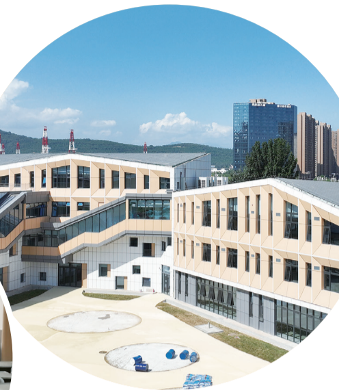
宝鸡高新第三幼儿园

楼道也是格外宽敞。该项目现场负责人告诉记者,项目规划设置30个教学班,新增1350个学位,进一步扩大主城区教育资源供给,缓解宝鸡南站片区常住人口剧增和学位供给不足的矛盾。除此之外,宝鸡市第一中学附属小学共设置24