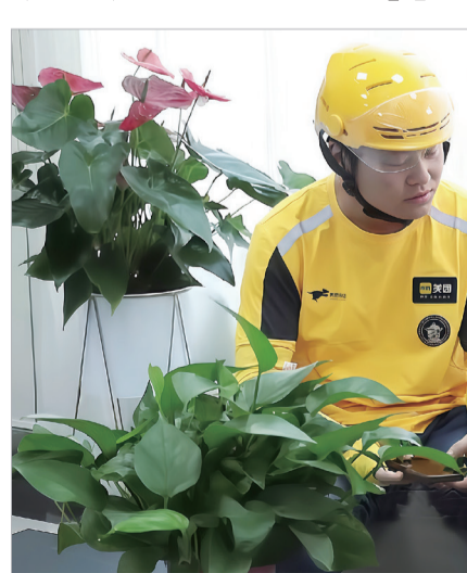
外卖员在驿站歇息

为了解决户外劳动者在就餐、饮水、如厕和休息等方面的实际困难与问题,今年宝鸡高新区税务局整合资源,在宝鸡高新区自助办税厅一角设立了24小时智慧工会驿站,专门为户外劳动者提供歇脚、喝水等服务。与一般的工会驿站不同的是,这里24小时“不打烊”,户外劳动者刷身份证即可进入。记者走进该驿站看到,小小的空间“五脏俱全”,不仅配备了沙发、茶几、智能电视、饮水机、微波炉、冰箱等基本设施,还有爱心雨伞、AED便携式体外除颤仪和定期更新的阅读架、爱