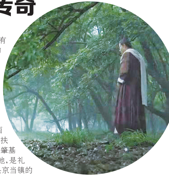
电影《封神:祸商》剧情截图

电影中频繁提及的“西岐”,正是今天的宝鸡岐山、扶风一带。这里是周人的创业肇基之地,是周礼文化的发祥地,是礼乐文明的诞生地。而岐山县京当镇的杜家村,相传就是周文王出生之地。