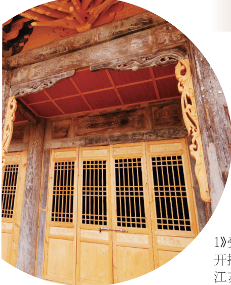
岐山三王庙正殿“瓜瓞绵绵”的匾额

中的“绵绵瓜瓞”,意思是子孙昌盛,与发源于宝鸡的周文化息息相关。岐山三王庙正殿的匾额“绵绵瓜瓞”正是这一典故的见证。