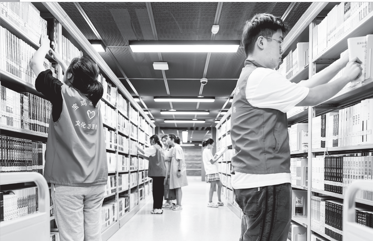
文化志愿者在市图书馆整理书架