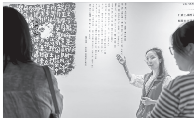
大学生志愿者讲解铭文

“多亏有你讲解，我们才能看懂这些珍贵的文物。”7月30日，在宝鸡青铜器博物院，两位来自重庆的游客在参观结束之际，向为他们义务讲解的文化志愿者致谢。当天，博物院新展《青铜铸文明——周秦文明之光》开展，展厅内人头攒动、观者如堵，文化志愿者们耐心细致的讲解，让游客更加深入地感受到“看中国，来宝鸡”的魅力。