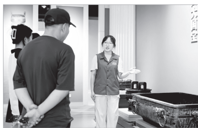
中学生志愿者讲解青铜器