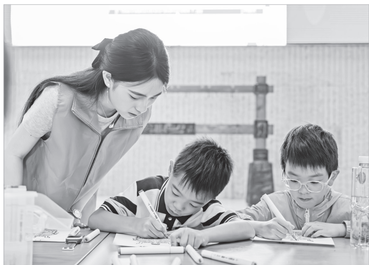
志愿者指导小朋友绘制青铜器纹饰