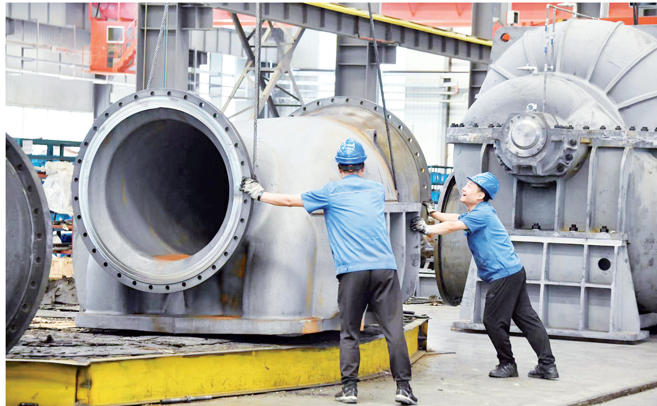
工人准备用混砂机制作3D打印材料

本报讯（记者 杨曙斌）记者从凤翔区了解到，总投资5亿元的兰州国器集团凤翔绿色铸造基地项目日前正式投产，引进了增材制造3D打印技术，实现了铸件的快速和高精度生产，可满足高端客户的个性化需求。