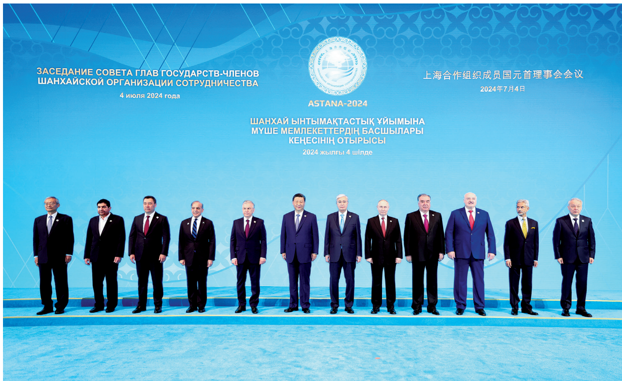
当地时间7月4日上午，国家主席习近平在阿斯塔纳独立宫出席上海合作组织成员国元首理事会第二十四次会议。这是习近平同上海合作组织成员国领导人集体合影。

新华社阿斯塔纳7月4日电 当地时间7月4日上午，国家主席习近平在阿斯塔纳独立宫出席上海合作组织成员国元首理事会第二十四次会议。