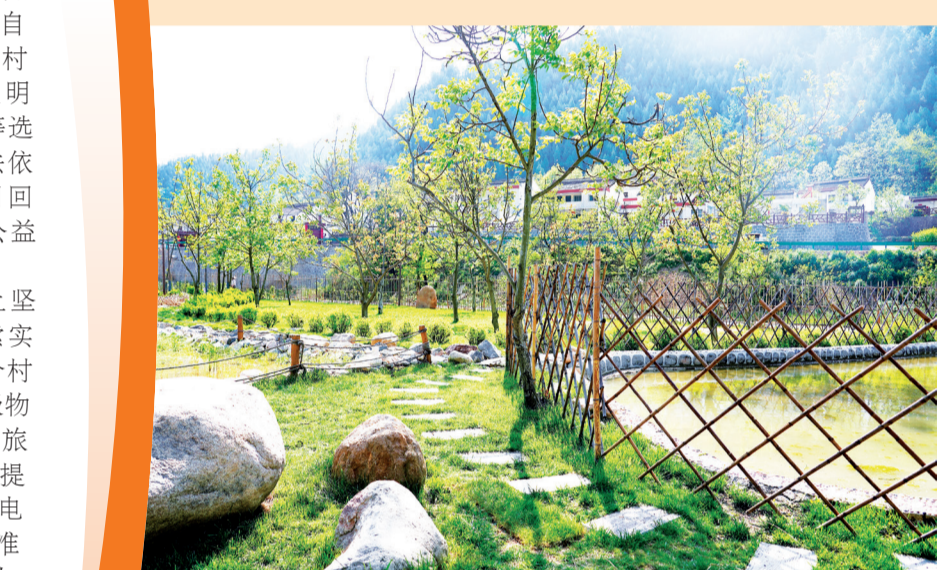
品农上川有机农业体验园