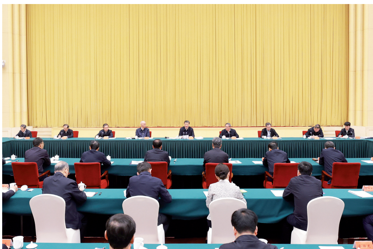
4月23日下午，中共中央总书记、国家主席、中央军委主席习近平在重庆主持召开新时代推动西部大开发座谈会并发表重要讲话。