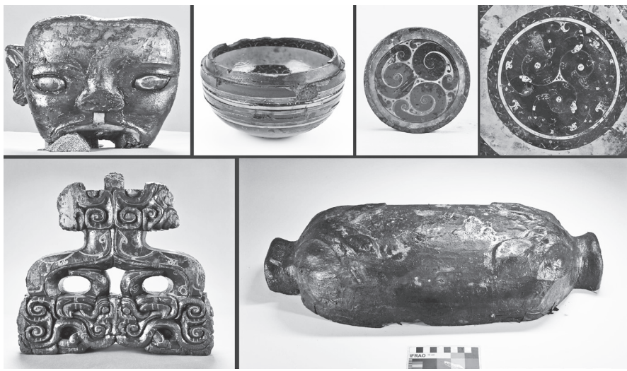
安徽淮南武王墩主墓室出土的部分漆器

（一号墓）东1室南端放置的大鼎粗测口径超过88厘米，比安徽博物院“镇院之宝”楚大鼎还大。