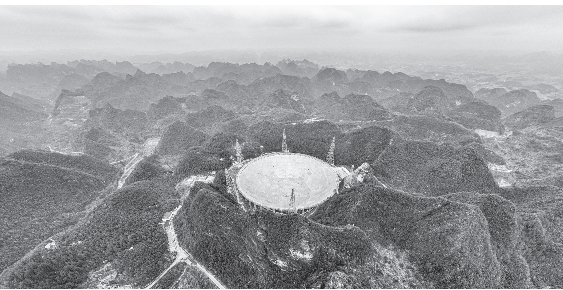
2024年2月26日拍摄的“中国天眼”全景(无人机照片,维护保养期间拍摄)。