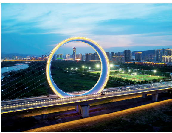
日月同辉造型的团结大桥