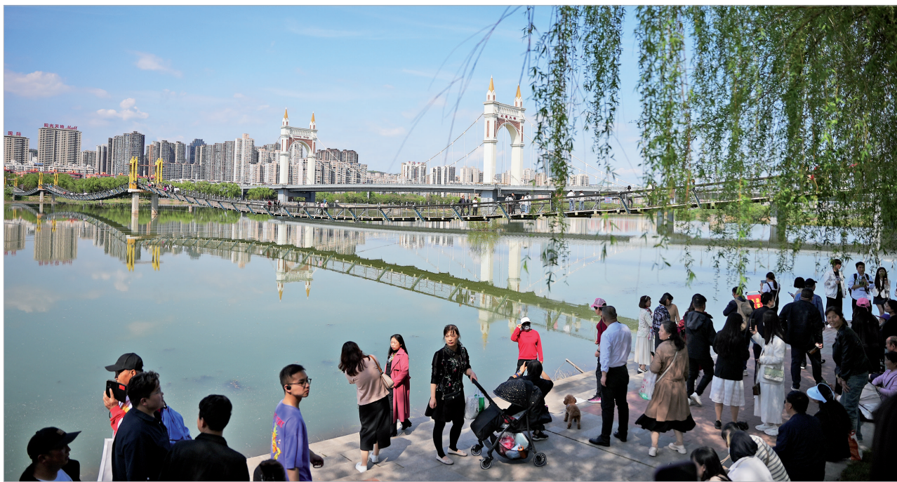
联盟大桥火热“出圈”,游客与市民竞相打卡。