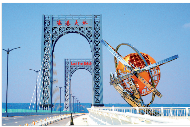
雄伟壮观的陆港大桥