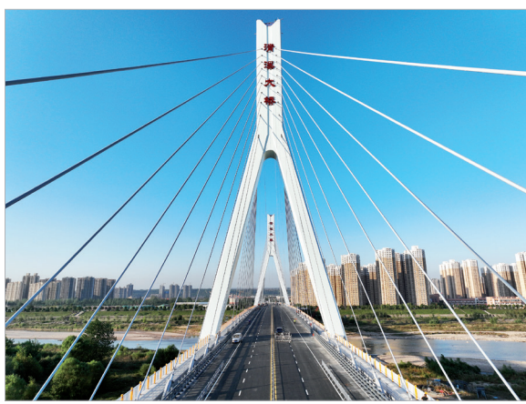
清溪大桥