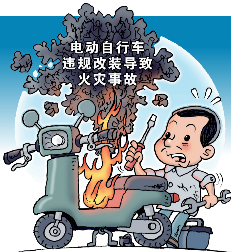
电动自行车 违规改装导致 火灾事故

在一些地方，门店会提供“先上牌后改装”服务。在南宁市仙葫大道的电动自行车销售门店，销售人员告诉记者，只要购买电动自行车，都可免费提供改装拆除限速装置和更换大功率电池等服务，并保证在车管所上牌时能获得符合“新国标”的车牌。