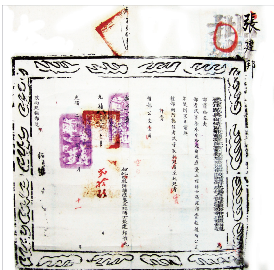
清代陕西巡抚部院公文