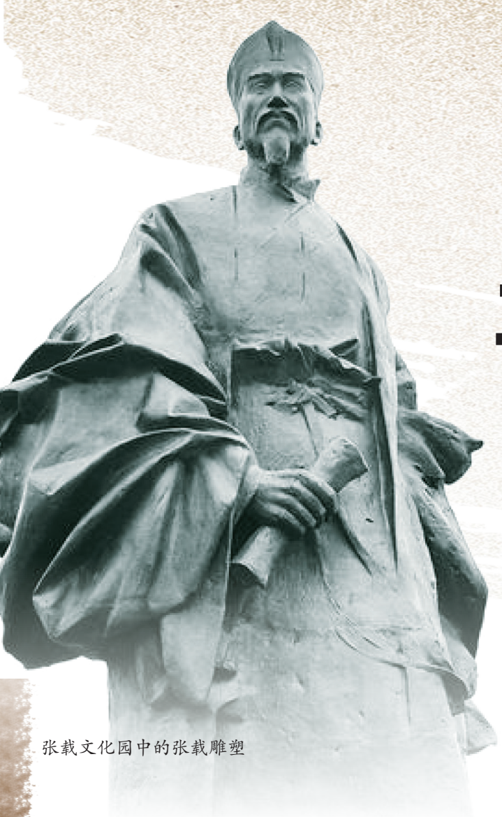
张载文化园中的张载雕塑