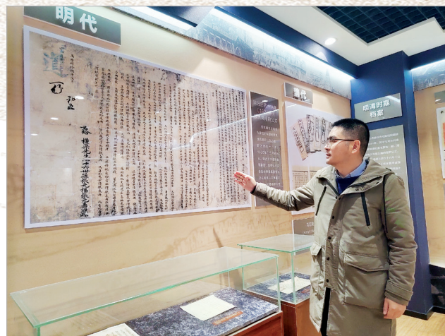
市档案馆工作人员介绍明代公文复印件

3月18日，记者在市档案馆举办的宝鸡市珍藏档案展中，看到三份与关学传承有关的公文档案，时间分别为明万历四十八年(1620年)、清光绪二十二年(1896年)以及1920年，三份公文的时间前后跨度达300年，这三份珍稀的公文档案是探究关学大儒张载后裔足迹、宝鸡地区关学传播的重要实物资料。