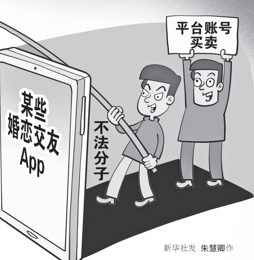
朱慧卿作

据介绍，平台虚假注册乱象增加了公安机关打击和整治难度。吉林省松原市公安局反诈民警边界说，在查办相关案件中，常常发现平台账号