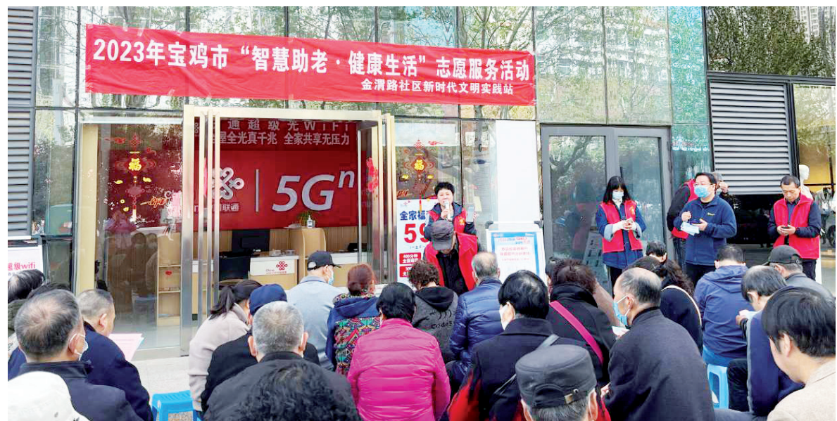
宝鸡联通工作人员走进社区开展智慧助老大讲堂活动