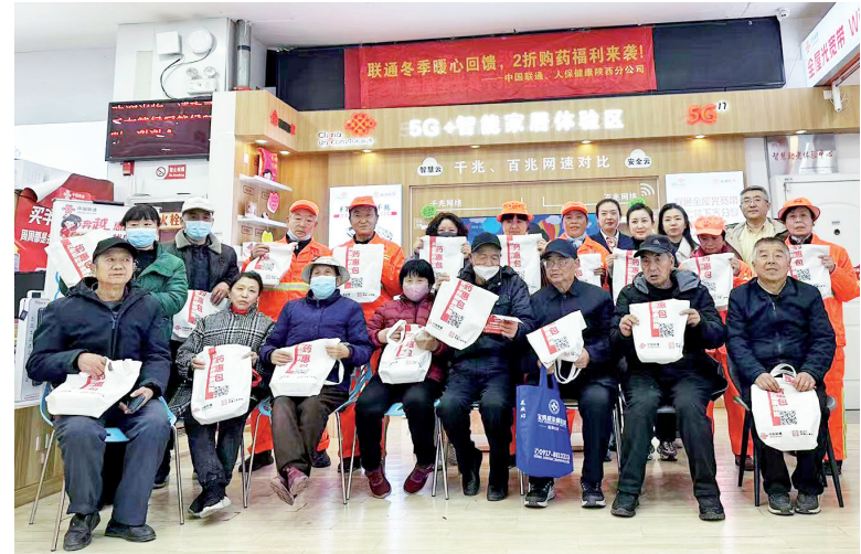
渭滨区经二路营业厅智慧助老大讲堂

智慧助老大讲堂活动主要以解决老年人跨越数字鸿沟为出发点,通过科普智能手机使用技巧和出行、手机支付等知识,助力他们走出在运用智能手机方面遇到的“不敢用、不会用、不能用”的窘境,真正融入数字时代。春暖花开时,宝鸡联通员工走进养老院,为老年人带去米、面、油等慰问品,并现场与老年人一起做游戏,倾听老年人讲他们“曾经的故