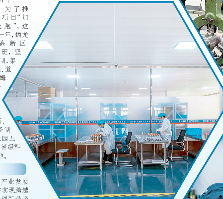
陕西埃尔森万克电气有限公司生产区一角

10余处,使工业园区环境得到了很大改观;结合创卫复审工作,他们狠抓市政道路环境综合治理,对新区垃圾卫生死角进行了清理,新建了曙光路步行街综合市场,加强新区环卫清扫保洁和绿化管护,进行精细化管理,使蟠龙高新区环境面貌得到了较大提升;对蟠龙文化公园设施进行了全面维修,并加强日常维护管理,为市民群众营造了整洁优美的游园环境。