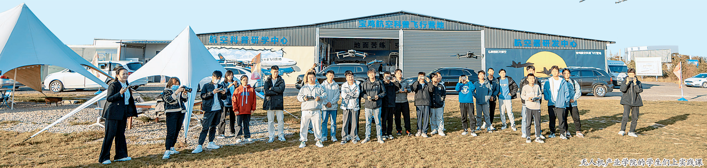
无人机产业学院的学生们上实践课