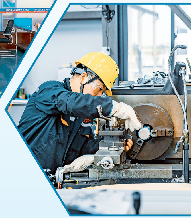
宝鸡奥龙过滤器材料有限责任公司工人加工管材