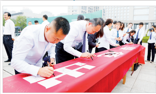
“绿色出行,美好生活”签名活动