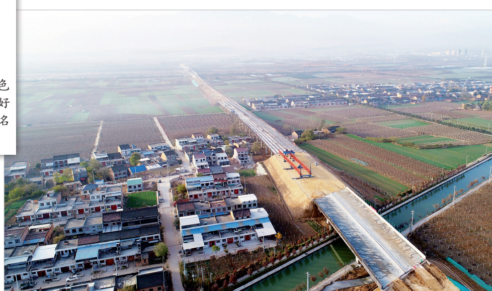
眉太高速公路路基已现雏形