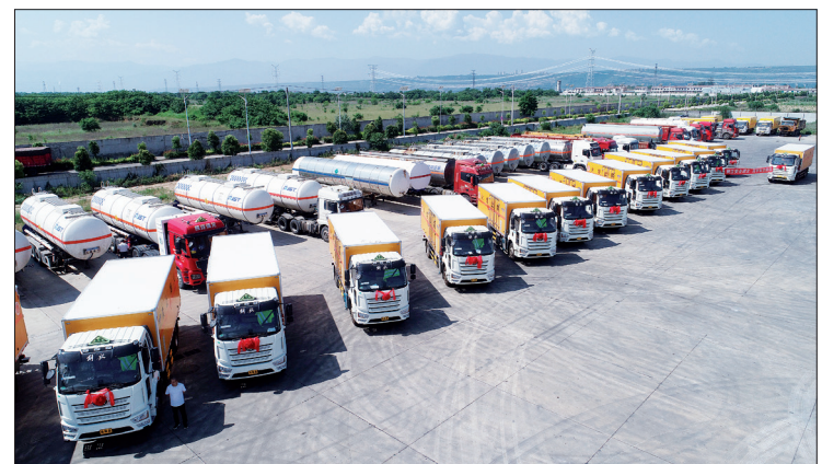
更新换代后的危化品运输车