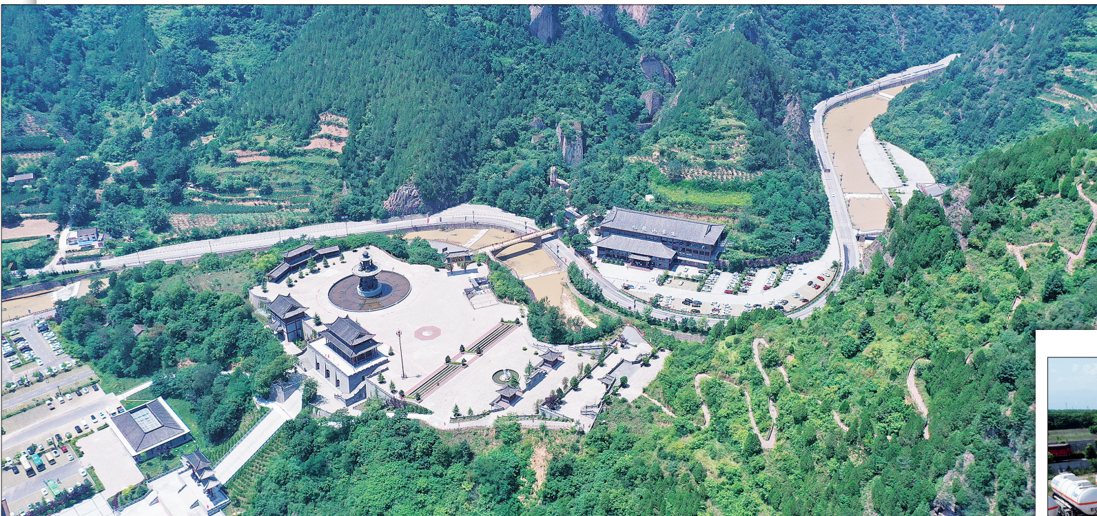
风景如画的九龙山旅游公路