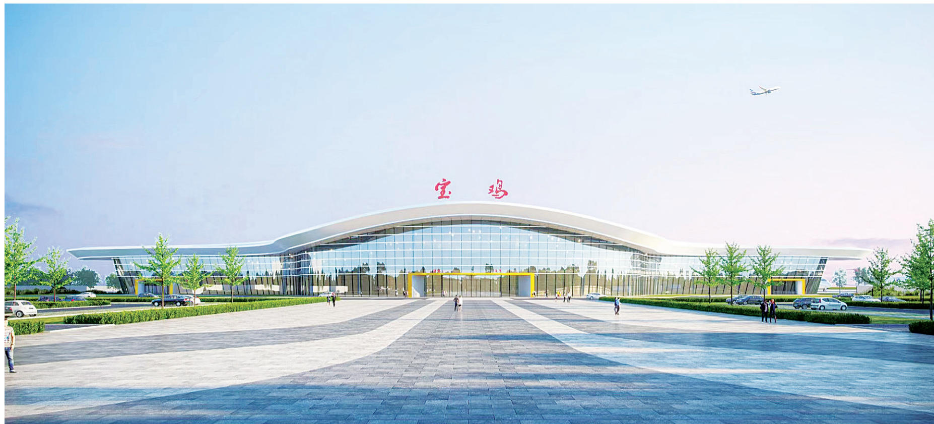
宝鸡机场航站楼建筑设计效果图

宝鸡是全国装备制造业名城,其本身航空制造业产业门类较多,研发和制造水平就很高,大飞机、神舟系列飞船等“大国重器”上都有“宝鸡造”。发展临空产业体系,必将带动宝鸡航空功能本身的拓展。记者在我市相关部门委托专业机构编